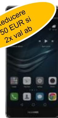
Huawei P9 194 EUR

pret redus: 144 EUR / 111 EUR Prelungire / Nou, portat, ppy