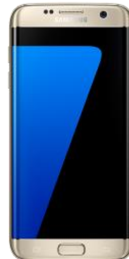
Samsung S7 EDGE 108.4 EUR