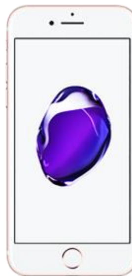
Iphone 7 32 GB 43.36 EUR