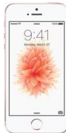
Iphone SE 32 GB 0 EUR