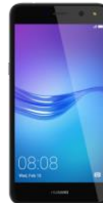
Huawei Y6 2017 DUAL SIM 43 EUR