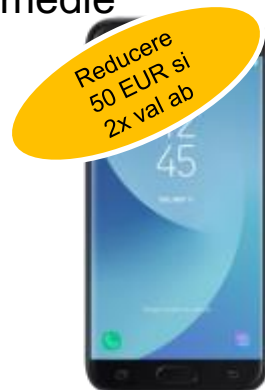
Samsung J5 2017 DUAL SIM 125 EUR reduc: 75EUR / 54.2EUR Prelungire / Nou, portat, ppy