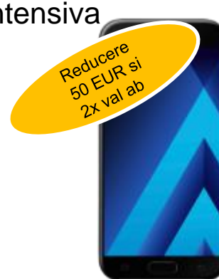
Samsung Galaxy A5 2017 148 EUR

pret redus: 98 EUR / 65 EUR Prelungire / Nou, portat, ppy