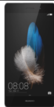
Huawei P8 LITE DUAL SIM 47 EUR