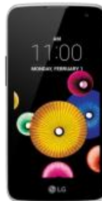
LG K4 2017 16 EUR