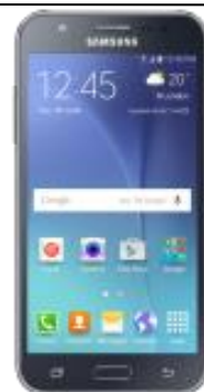
Samsung Galaxy J3 47.2 EUR