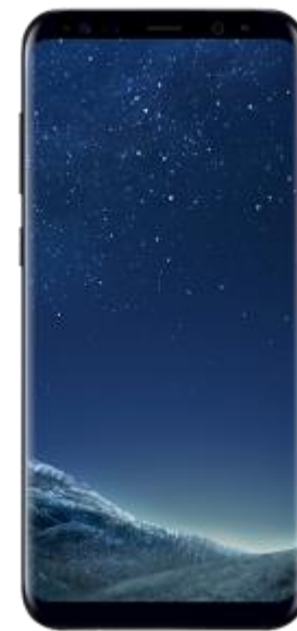
Samsung Galaxy S8 84.71 EUR