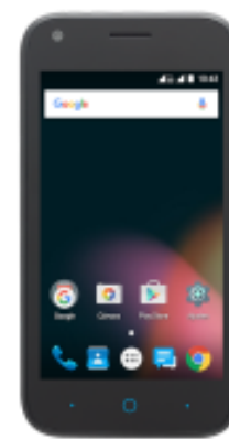
ZTE Blade L110 N DUAL SIM 0 EUR