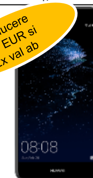
Huawei P10 LITE DUAL SIM 131 EUR

pret redus: 81 EUR / 55.2 EUR Prelungire / Nou, portat, ppy