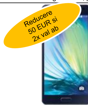
Samsung Galaxy A3 2017 131 EUR

pret redus: 81 EUR / 55.2 EUR Prelungire / Nou, portat, ppy