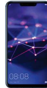
0 EUR Huawei P 20 LITE DualSIM