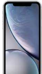
170EUR IphoneXR 64GB