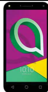
0 EUR Alcatel U58GB DualSIM