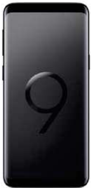
Samsung S9 64 GB 0 EUR