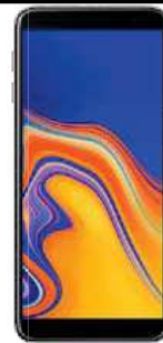
4 EUR Samsung J4 PLUS Dual SIM