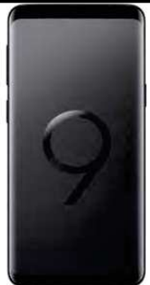
0 EUR Samsung S9 Dual SIM