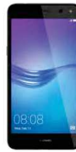
12.61 EUR Huawei Y6 Dual SIM 2018