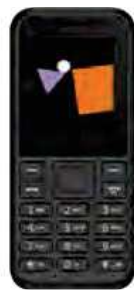
0 EUR OrangeHapi