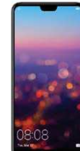
71 EUR Huawei P20PRO