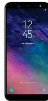
Samsung A6 DUAL SIM 2018 0 EUR

Ab. 10.1EUR + Ab. 10.1EUR + Ab. 10.1EUR =