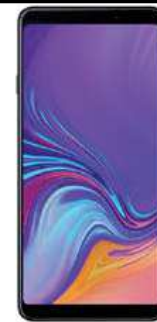
49.58 EUR Samsung A9 DUALSIM