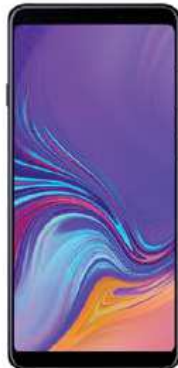
Samsung A9 49.58 EUR