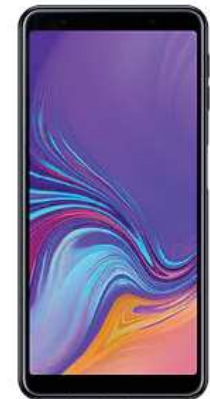
Samsung A7 DUAL SIM 2018 0 EUR

Ab. 10.1EUR + Ab. 10.1EUR + Ab. 10.1EUR =