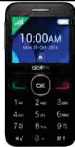
de la 7.97 EUR Alcatel2008 Senior

Telefoane in limita stocului. Traficul internet ce poate fi consumat in roaming SEE se calculeaza dupa formula reglementata UE.