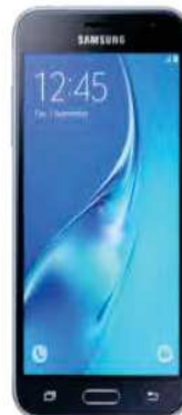
Samsung J3 DUAL SIM 0 EUR