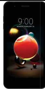
17.41 EUR LGK9