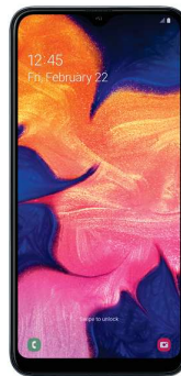
Samsung Galaxy A20 0 EUR