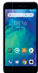
dela 13.21 EUR Xiaomi REDMI GO