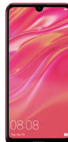
de la 9.2 EUR Huawei Y7 DualSIM2019