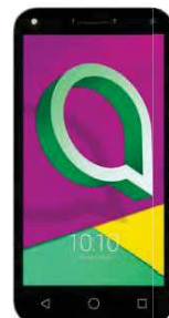
de la 32.54 EUR Alcatel 1X