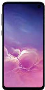
Samsung S10 128GB 160.5 EUR