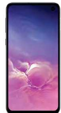
Samsung S10 E 128GB 0 EUR

Ab. 10.1EUR + Ab. 10.1EUR + Ab. 10.1 EUR + Ab. 10.1 EUR =