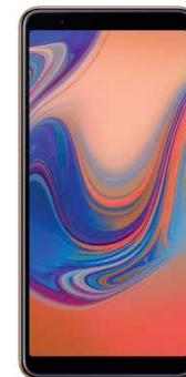
Samsung A50 33EUR

Ab. 10.1EUR + Ab. 10.1EUR + Ab. 10.1 EUR + Ab. 10.1 EUR =