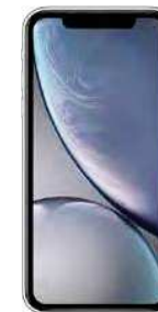
195 Eur cu pachet protectie 167 EUR fara pachet protectie