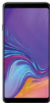
Samsung A70 0 EUR