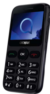
7.13 EUR Alcatel 2019 Senior

Telefoane in limita stocului. Traficul internet ce poate fi consumat in roaming SEE se calculeaza dupa formula reglementata UE.